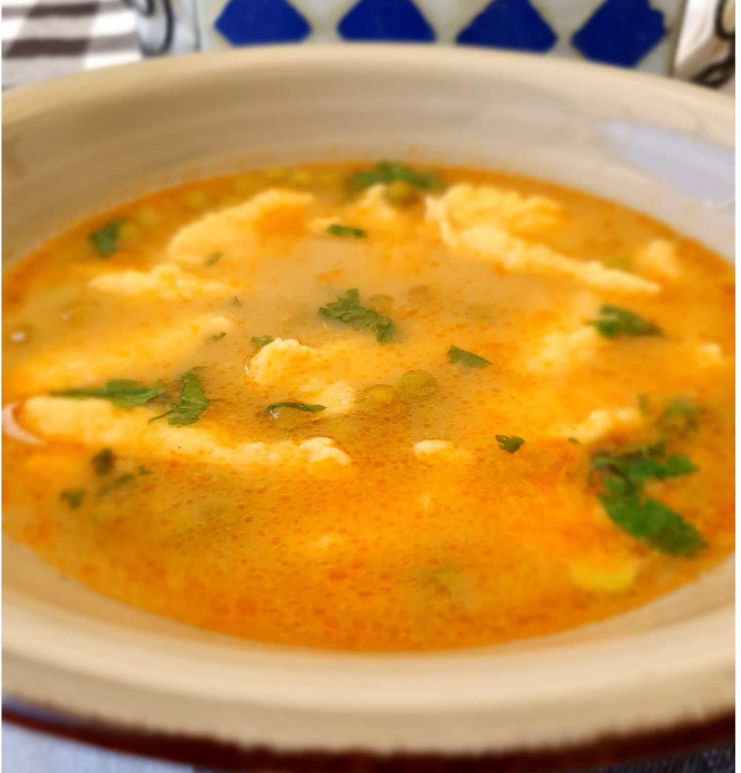
Moja obľúbená, rýchla a chutná polievka.